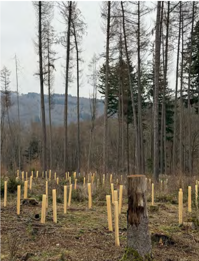
Die neu bepflanzte Fläche im Adelheidtal mit geschützten Jungbäumen.

Vorstand der Suwelack-Stiftung und Gemeinde Schlungenbad