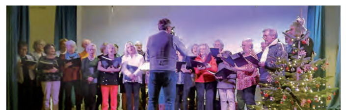
Der Chor bei der Weihnachtsfeier in Aktion.