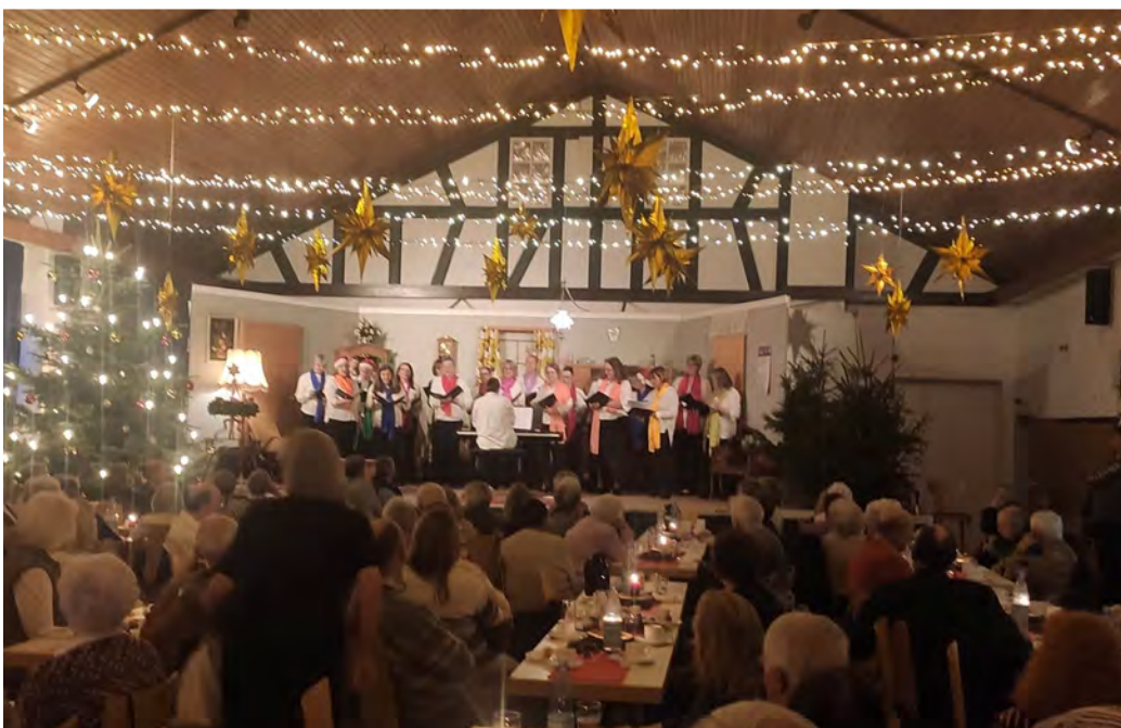
Gesangseinlage der United Voices aus Wambach bei der Seniorenweihnachtsfeier.