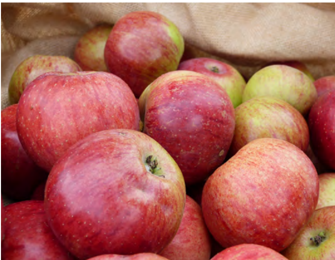
Regionales Obst von der selbst gepflegten Streuobstwiese ist frisch, schmeckt und gewinnt zunehmend an Bedeutung.

Ausbildung „Zertifizierter Landschaftsobstbauer“ – Noch einige Plätze frei für das Jahr 2026