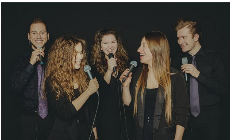
Die A-cappella-Gruppe Lylac begleitet die Jubiläumsfeier in der Oberberg Parkklinik mit ihrem preisgekrönten Sound.

Eintrittskarten für die Veranstaltung sind zum Preis von 12 Euro (ermäßigt 9 Euro) im Vorverkauf und an der Abendkasse am Empfang der Klinik sowie per E-Mail an parkklinik@oberbergkliniken.de erhältlich. Die Einnahmen und Spenden des Abends kommen dem Schlangenbader Bündnis für Demokratie und Grundrechte zugute.