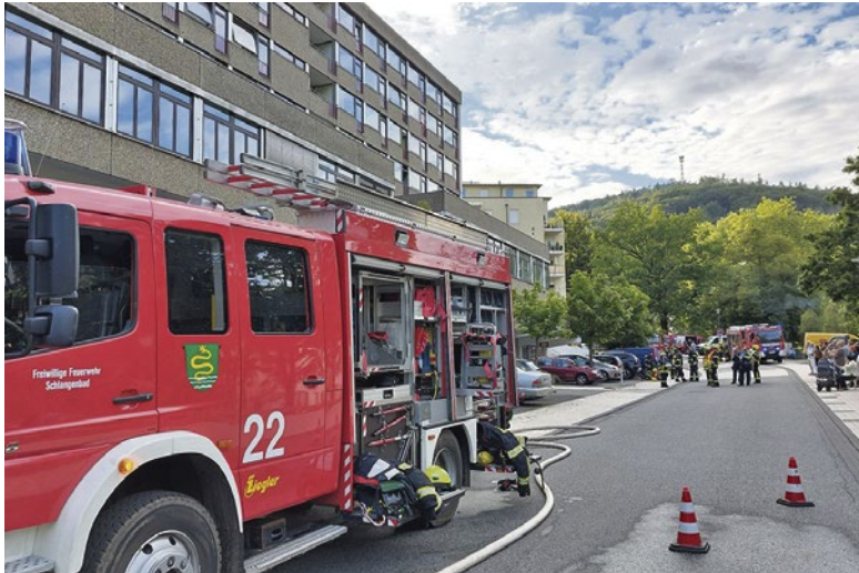
Blick auf die Einsatzstelle in der Rheingauer Straße.

Schnelles Handeln der Freiwilligen Feuerwehren verhindert Schlimmeres