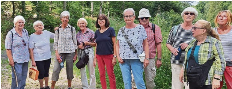
Die Mitläufer der vergangenen „Spazierwanderung“ bekundeten einhellig, dass sich alle auf das nächste Event freuen.

richtungen“ richten sich vornehmlich an Menschen ab 60 Jahren, die gerne in Gesellschaft mit einer guten Portion Gemütlichkeit bis zu 2-stündige Touren unternehmen wollen. Bestandteil der Spazierwanderungen ist auch eine gemeinsame anschließende Stärkung (in Gaststätten oder Picknick).