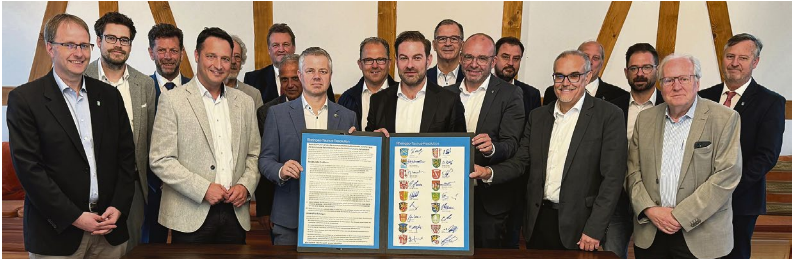
Alle Bürgermeister und der Landrat des Rheingau-Taunus-Kreises fordern ein Ende der kommunalen Unterfinanzierung.