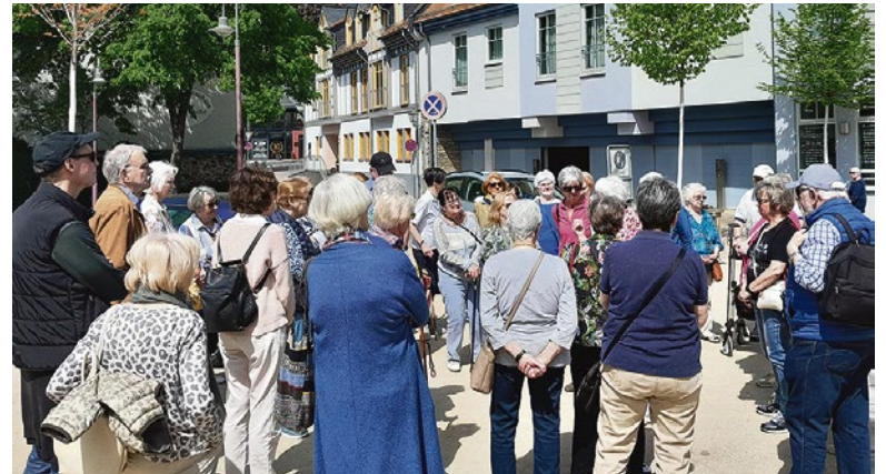
Bei strahlendem Sonnenschein erkunden 35 Senioren der Gemeinde die malerische Altstadt Idsteins.