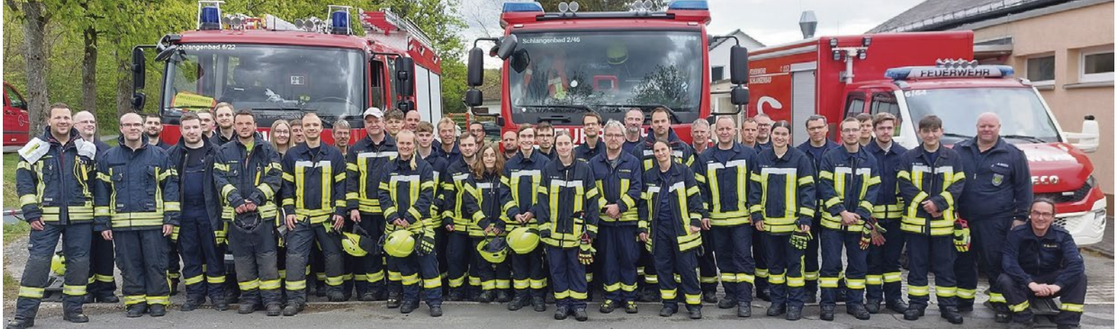
Gruppenbild aller Beteiligten am Ende des Übungstages

Gemeinsamer Ausbildungstag „Wald- und Vegetationsbrandbekämpfung“ der Feuerwehr der Gemeinde Schlängenbad