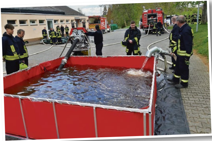
Löschwasserübergabestation mit mobilem 5.000 Liter faltbehälter

Hier werden die vorhandenen Waldbrandwerkzeuge und Löschgeräte vorgestellt und besprochen. Im Anschluss an die Vorstellung wurden die Waldbrandwerkzeuge und -geräte gemeinsam bei Löschmaßnahmen eingesetzt. Hier wird mittels Feuerpatschen und Löschrucksack der Brand bekämpft.