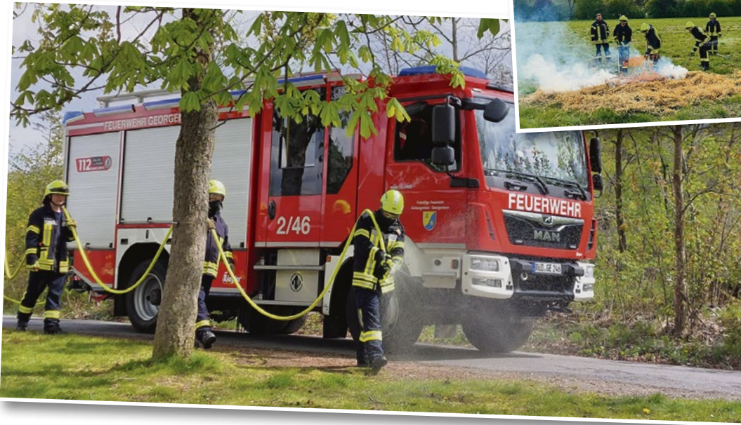
Mittels des sog. „Pump-and-Roll“-Betriebes kann ein Vegetationsbrand entlang des Feuersaumes mit einem Löschfahrzeug und einer Löschmannschaft während der Fahrt bekämpft werden.

kurzen Schlauchleitung und einer Löschmannschaft Löschmaßnahmen wie z.B. am Fahrbahnrand oder dem Feuersaum während der Fahrt durchgeführt werden können.