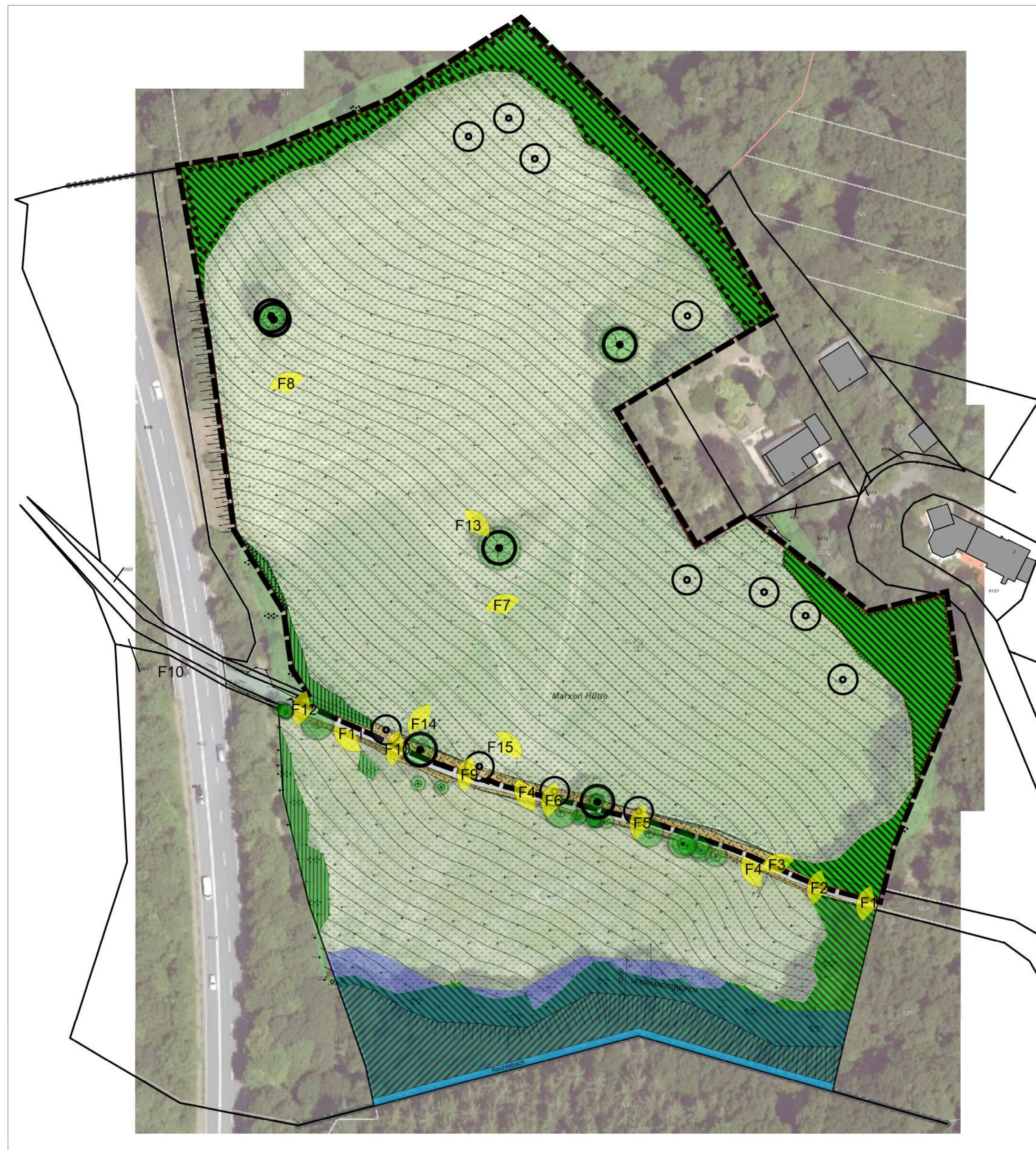
Fotodokumentation Mai 2023