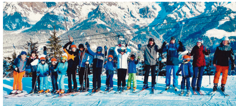
Alle Teilnehmer der SG-Skifahrt hatten mächtig Spaß im Schnee.