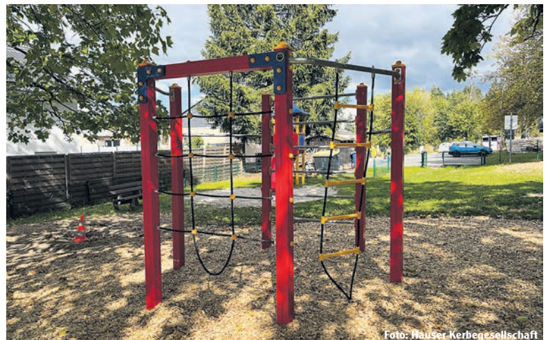
Klettergerüst für die Kleinen – gesponsort vom Kartoffelfest-Erlös.

tan nicht stemmbar ist, wird unter den Ausschuss- und Kerbegesellschaft-Mitgliedern kein Trübsal geblasen. Viele sind motivierter denn je und haben Lust, statt des überregional bekannten Kartoffelfests die eine oder andere kleinere Veranstaltung für das Dorf auf die Beine zu stellen. Verraten wird im Moment noch nichts, aber Ideen gibt es schon einige! Alle Hauser, die Lust haben, sich aktiv ins Dorfleben einzubringen, sind herzlich eingeladen und können sich unter vorstand-hkg@gmx.de zur weiteren Planung und Organisation melden – wir freuen uns über neue Gesichter, neue Ideen und helfende Hände. Alle anderen dürfen gespannt sein und sich darauf freuen, bald wieder in geselliger Runde in Hausen zusammenzukommen!