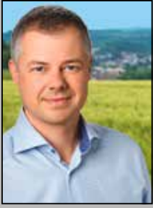
Marco Eyring Bürgermeister der Gemeinde Schlungenbad